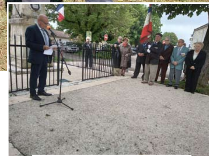
Commémorations au monument aux morts

Comme tous les ans, la commune a rendu hommage aux anciens combattants et aux morts pour la France. La fin de la seconde guerre mondiale a été commémorée le 8 mai. En 2025, cette commémoration retrouvera son cadre habituel : la fête du village.