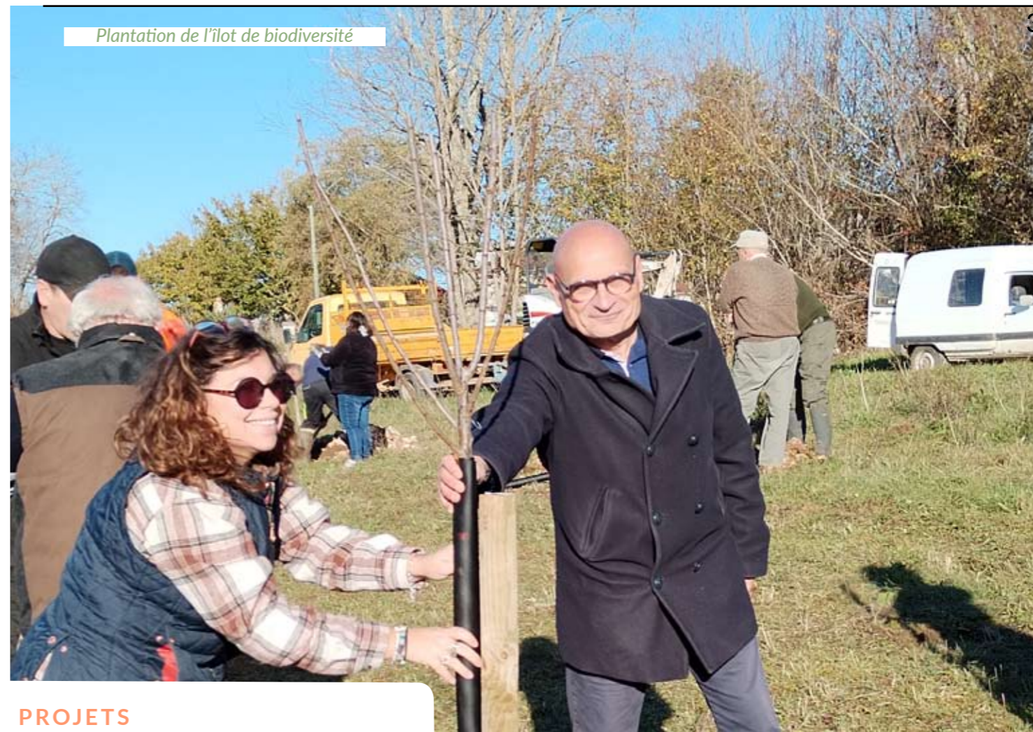
Plantation de l'îlot de biodiversité